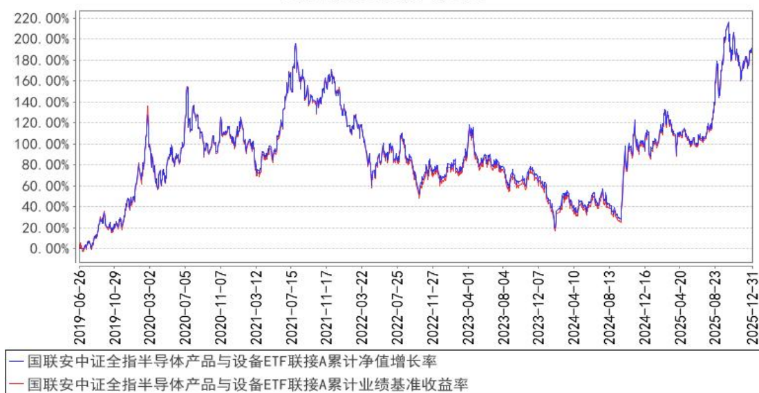
国联安中证全指半导体产品与设备ETF联接A累计净值增长率与同期业绩比较基准收益率的历史走势对比图

注：1、本基金业绩比较基准为中证全指半导体产品与设备指数收益率*95%+银行活期存款利率(税后)*5%；