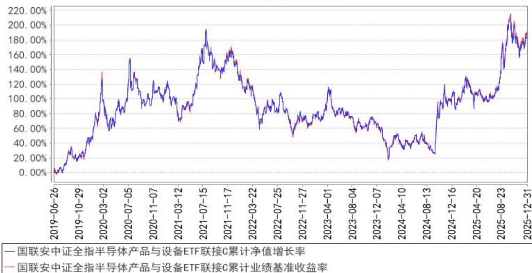
国联安中证全指半导体产品与设备ETF联接C累计净值增长率与同期业绩比较基准收益率的历史走势对比图

注：1、本基金业绩比较基准为中证全指半导体产品与设备指数收益率*95%+银行活期存款利率(税后)*5%；