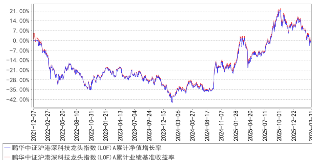
鹏华中证沪港深科技龙头指数(LOF) A 累计净值增长率与同期业绩比较基准收益率的历史走势对比图