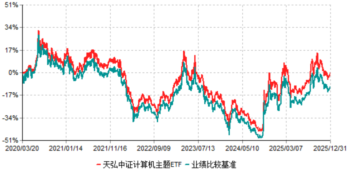
天弘中证计算机主题ETF累计净值增长率与业绩比较基准收益率历史走势对比图 (2020年03月20日-2025年12月31日)