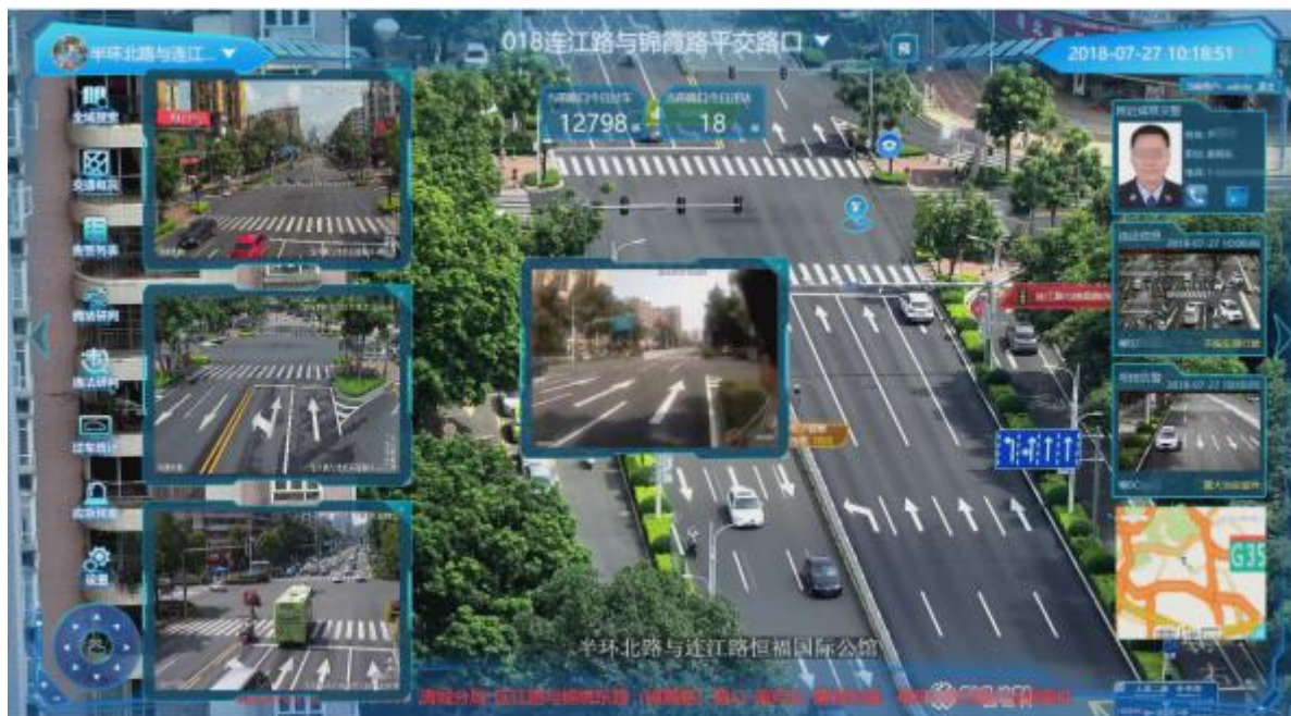
交通监测云行系统

交警场景方面，交通监测云行系统是一款增强现实的交通视频实景集成指挥系统，主要用于点交通枢纽、常发交通拥堵点、交通事故多发点和一些重点路段等等，辅助交通管理部门进行交通管控、交通态势监测和交通可视化指挥，创新性的将AR与汽车电子标识技术、无人机技术融合。2019年3月，云行系统护航清远马拉松项目。