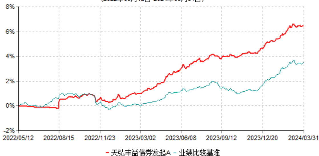
天弘丰益债券发起A累计净值增长率与业绩比较基准收益率历史走势对比图 (2022年05月12日-2024年03月31日)