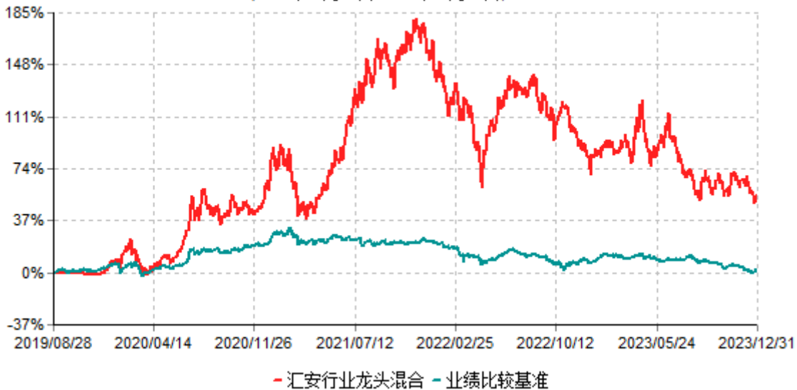
汇安行业龙头混合型证券投资基金累计净值增长率与业绩比较基准收益率历史走势对比图 (2019年08月28日-2023年12月31日)