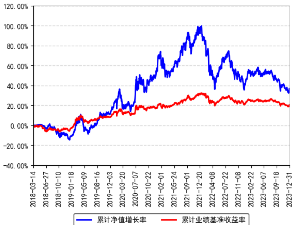
南方希元可转债债券累计净值增长率与同期业绩比较基准收益率的历史走势对比图