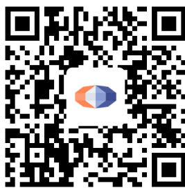
国泰君安资管 APP 下载二维码

投资者可以在应用市场搜索“国泰君安资管”，或者扫描下方二维码，下载国泰君安资管 APP，了解基金产品、服务等信息。