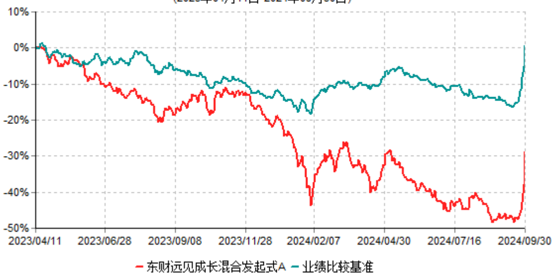
东财远见成长混合发起式A累计净值增长率与业绩比较基准收益率历史走势对比图 (2023年04月11日-2024年09月30日)