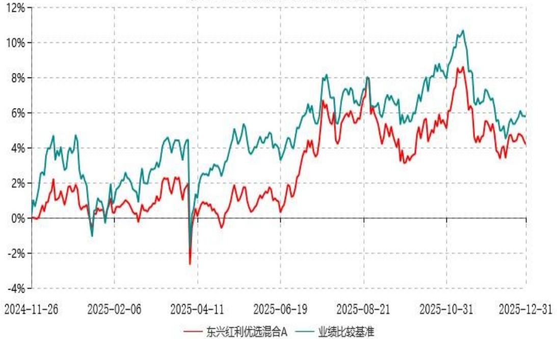
东兴红利优选混合C累计净值增长率与业绩比较基准收益率历史走势对比图