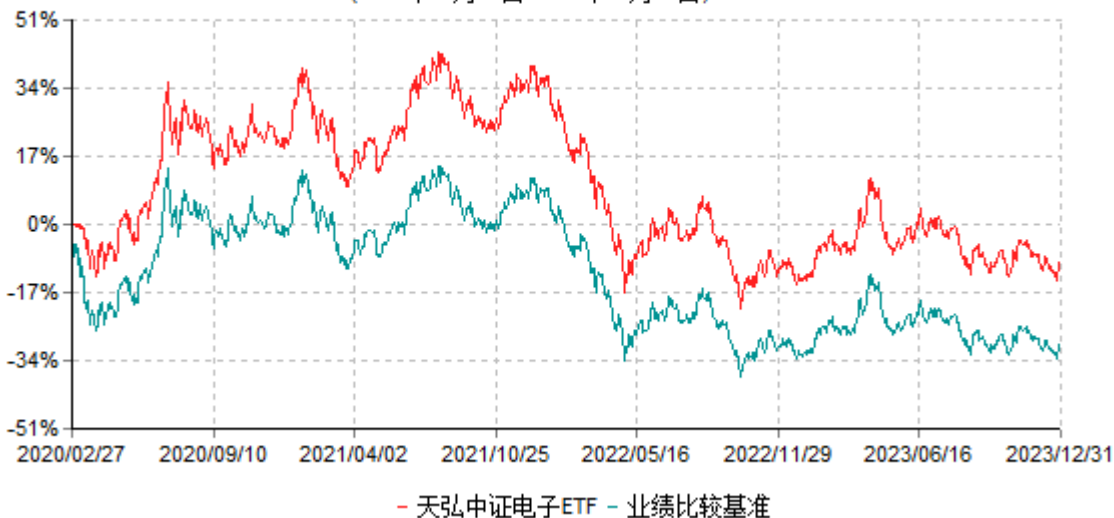
天弘中证电子交易型开放式指数证券投资基金累计净值增长率与业绩比较基准收益率历史走势对比图 (2020年02月27日-2023年12月31日)