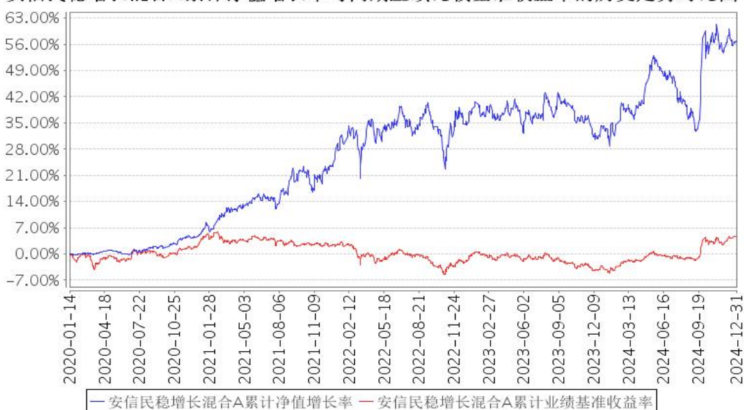
安信民稳增长混合A累计净值增长率与同期业绩比较基准收益率的历史走势对比图