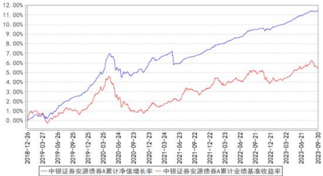
中银证券安源债券A累计净值增长率与同期业绩比较基准收益率的历史走势对比图