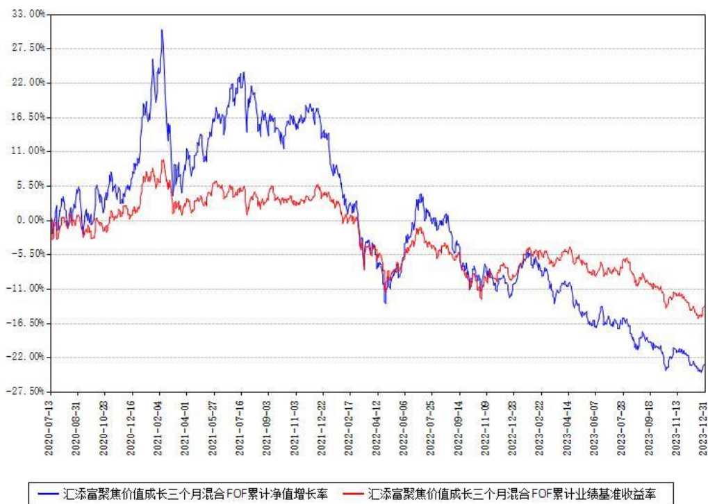
汇添富聚焦价值成长三个月混合FOF累计净值增长率与同期业绩基准收益率对比图

注：本基金建仓期为本《基金合同》生效之日（2020年07月13日）起6个月，建仓期结束时各项资产配置比例符合合同约定。