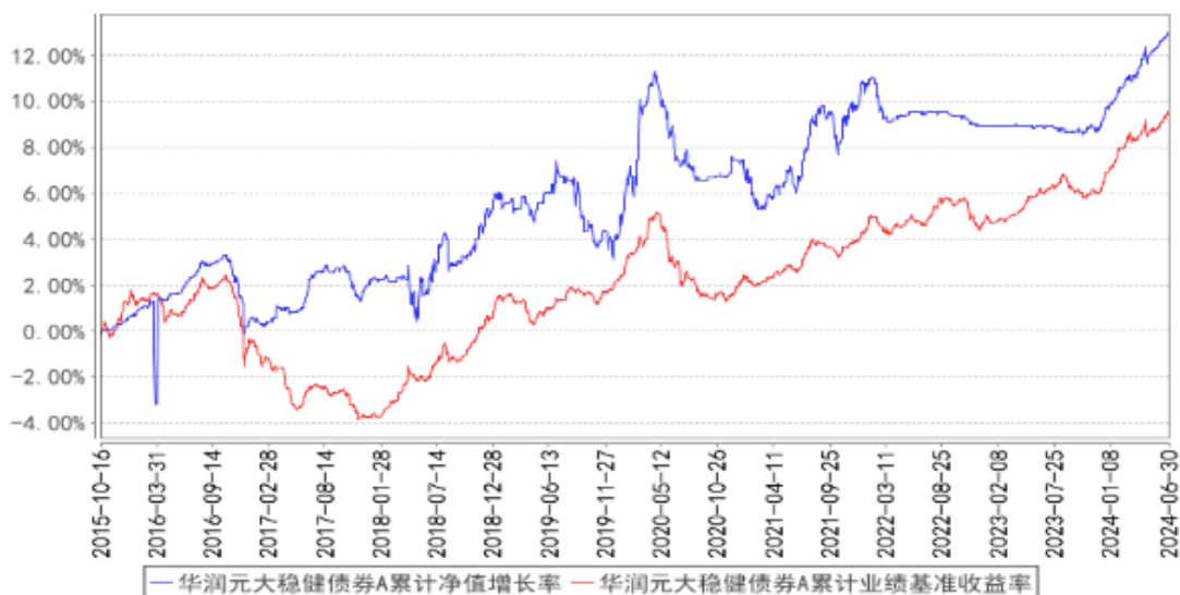
华润元大稳健债券A累计净值增长率与同期业绩比较基准收益率的历史走势对比图

（二）自基金合同生效以来基金累计净值收益率变动及其与同期业绩比较基准收益率变动的比较（2015年10月16日至2024年6月30日）