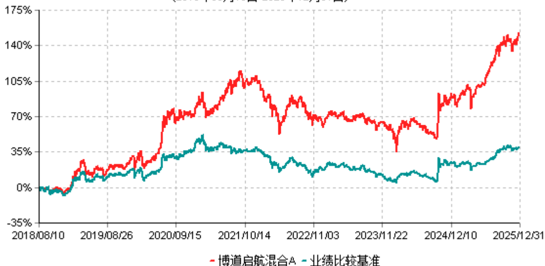
博道启航混合A累计净值增长率与业绩比较基准收益率历史走势对比图 (2018年08月10日-2025年12月31日)

注：本基金建仓期为自基金合同生效日起的6个月。截至建仓期结束，本基金各项资产配置比例符合基金合同及招募说明书有关投资比例的约定。