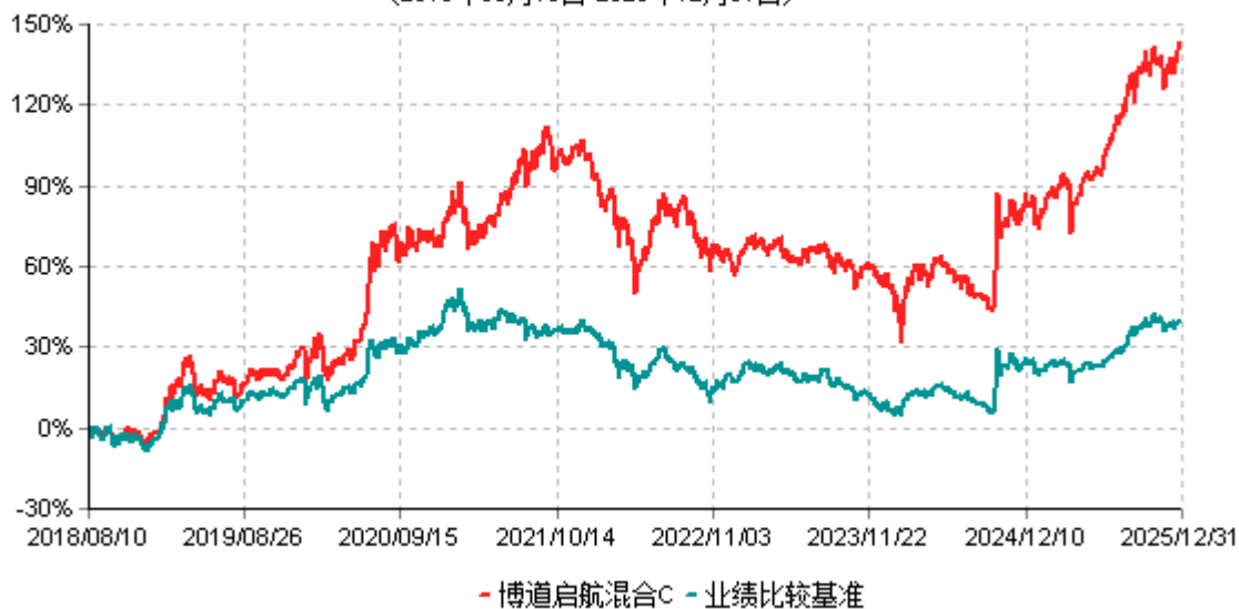
博道启航混合C累计净值增长率与业绩比较基准收益率历史走势对比图 (2018年08月10日-2025年12月31日)

注：本基金建仓期为自基金合同生效日起的6个月。截至建仓期结束，本基金各项资产配置比例符合基金合同及招募说明书有关投资比例的约定。