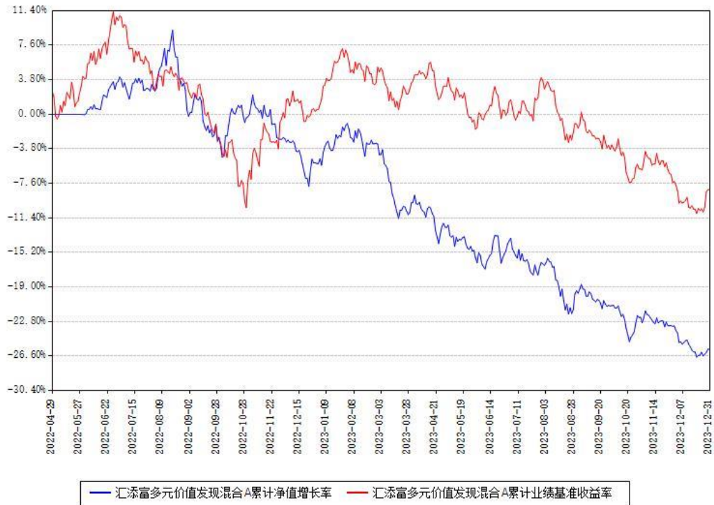
汇添富多元价值发现混合A累计净值增长率与同期业绩比较基准收益率对比图