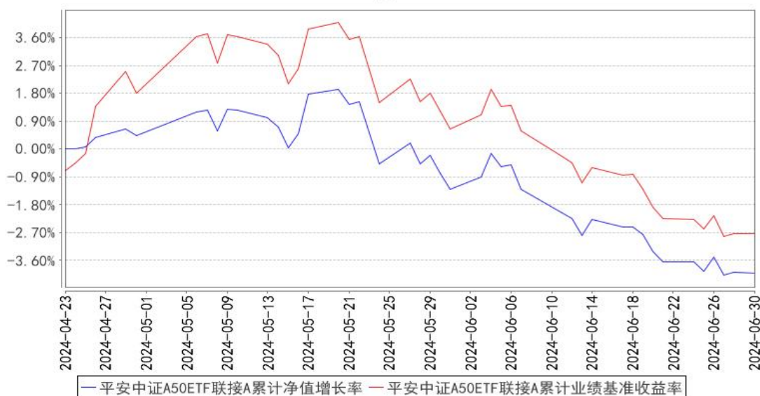
平安中证A50ETF联接A累计净值增长率与同期业绩比较基准收益率的历史走势对比图