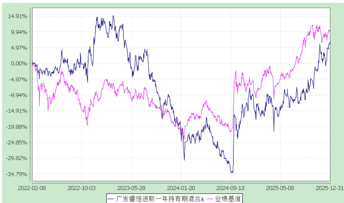
广发睿恒进取一年持有期混合 C