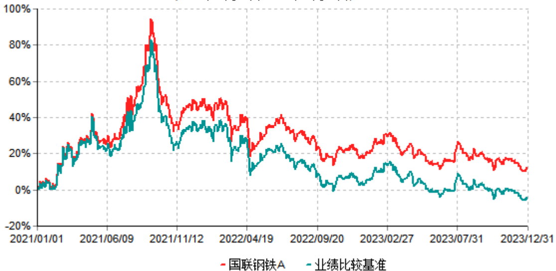
国联钢铁A累计净值增长率与业绩比较基准收益率历史走势对比图 (2021年01月01日-2023年12月31日)