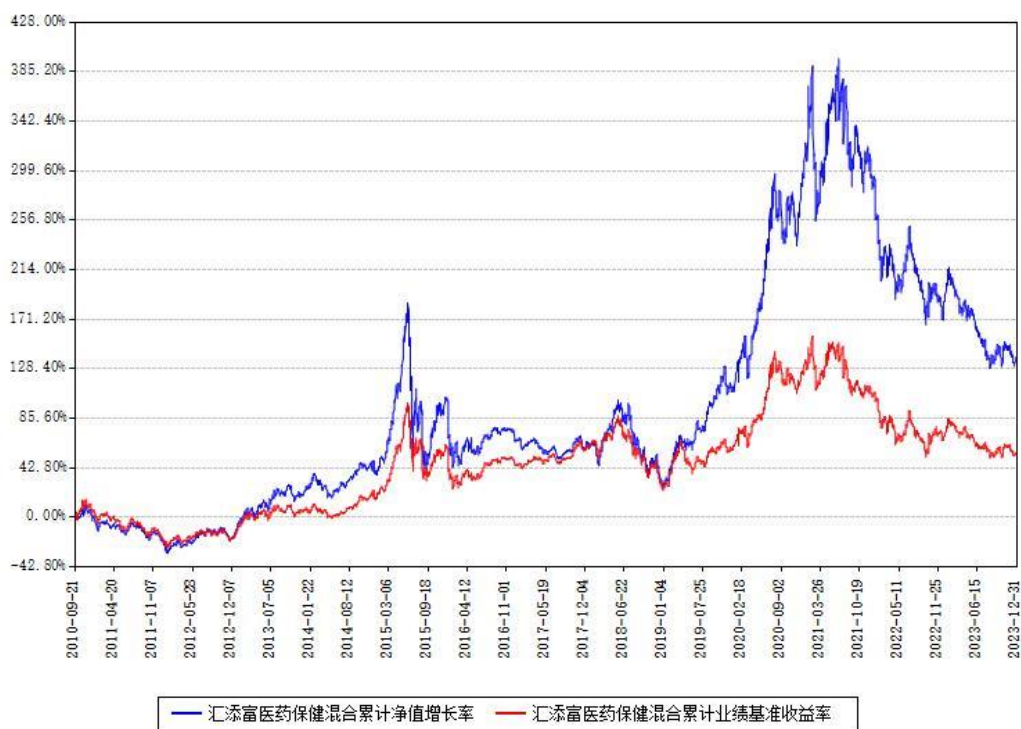
汇添富医药保健混合累计净值增长率与同期业绩基准收益率对比图

注：本基金建仓期为本《基金合同》生效之日（2010年09月21日）起6个月，建仓期结束时各项资产配置比例符合合同约定。