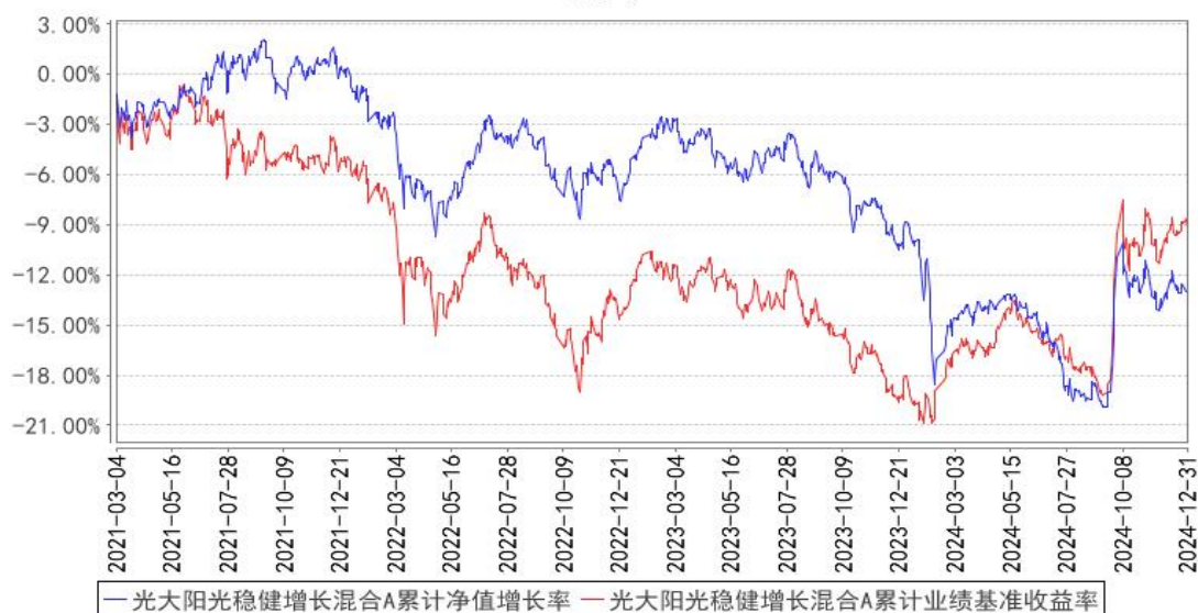
光大阳光稳健增长混合A累计净值增长率与同期业绩比较基准收益率的历史走势对比图