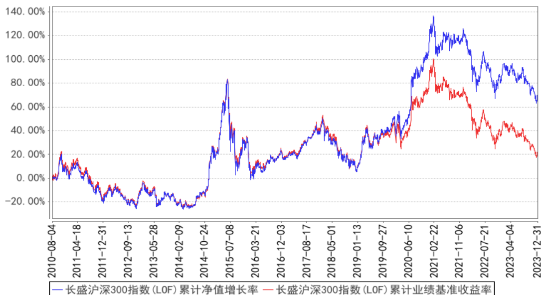
长盛沪深300指数(LOF)累计净值增长率与同期业绩比较基准收益率的历史走势对比图

注：按照本基金合同规定，本基金管理人应当自基金合同生效之日起三个月内使基金的投资组合比例符合基金合同的约定。本报告期内，本基金的各项资产配置比例符合基金合同约定。