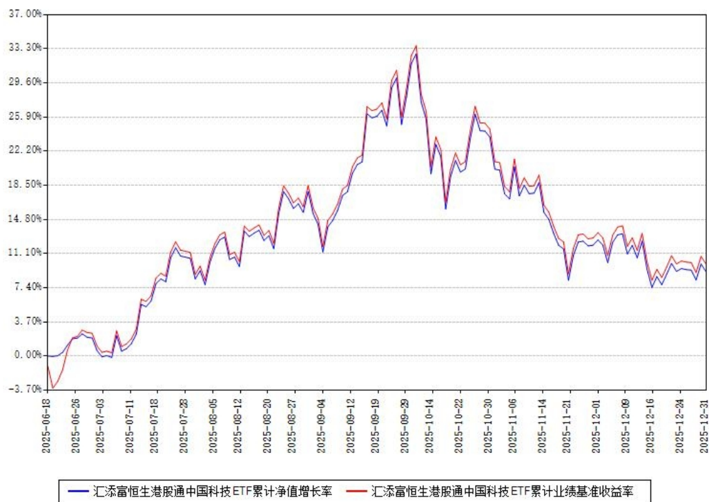
汇添富恒生港股通中国科技ETF累计净值增长率与同期业绩基准收益率对比图

注：本《基金合同》生效之日为 2025 年 06 月 18 日，截至本报告期末，基金成立未满一年。本基金建仓期为本《基金合同》生效之日起 6 个月，截至本报告期末，本基金已完成建仓，建仓期结束时各项资产配置比例符合合同约定。