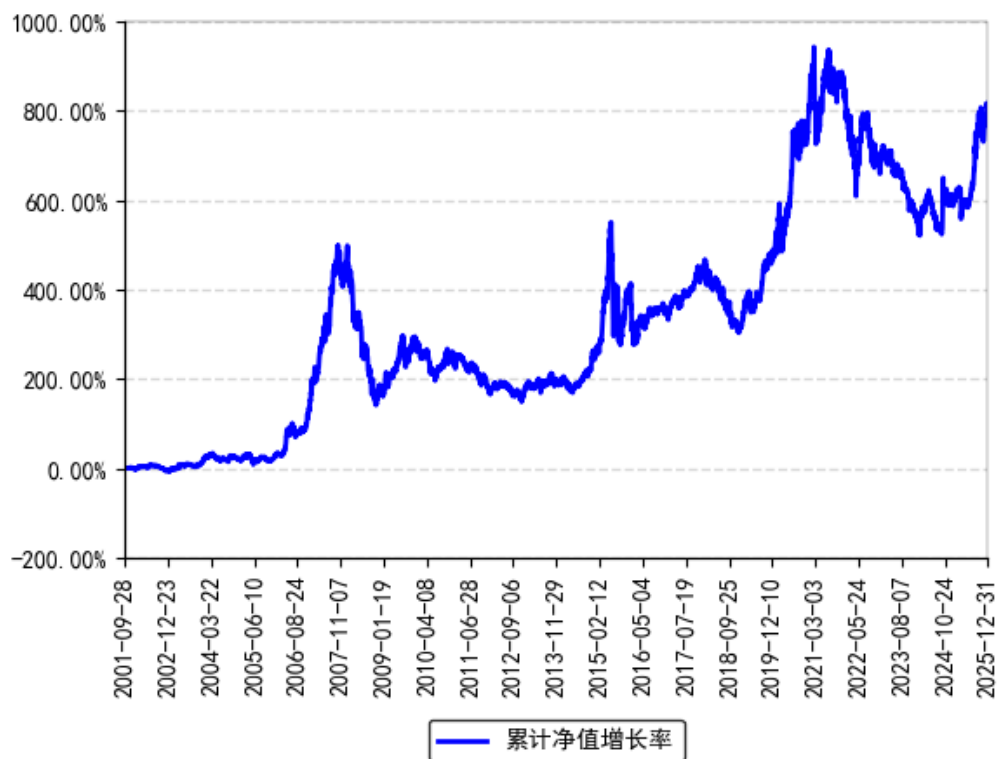
南方稳健成长混合累计净值增长率与同期业绩比较基准收益率的历史走势对比图