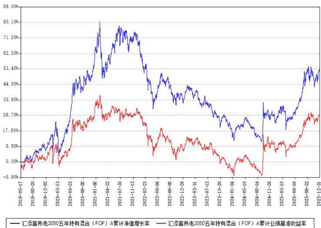
汇添富养老2050五年持有混合 (FOF) Y累计净值增长率与同期业绩基准收益率对比图