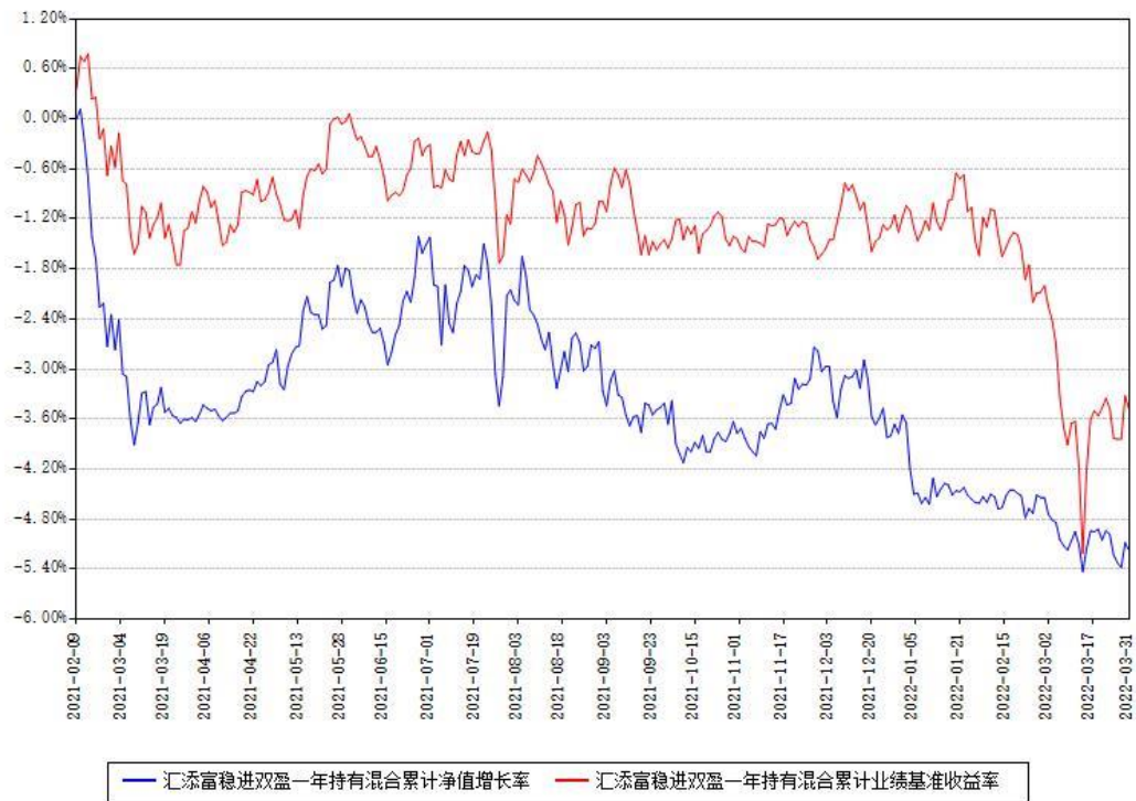
汇添富稳进双盈一年持有混合累计净值增长率与同期业绩基准收益率对比图