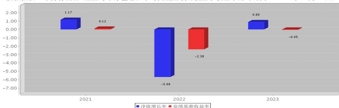
安信招信一年持有混合C基金每年净值增长率与同期业绩比较基准收益率的对比图（2023年12月31日）