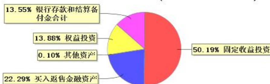
投资组合资产配置图表 (2023年12月31日)

● 固定收益投资 ● 买入返售金融资产 ● 其他资产 ● 权益投资 ● 银行存款和结算备付金合计