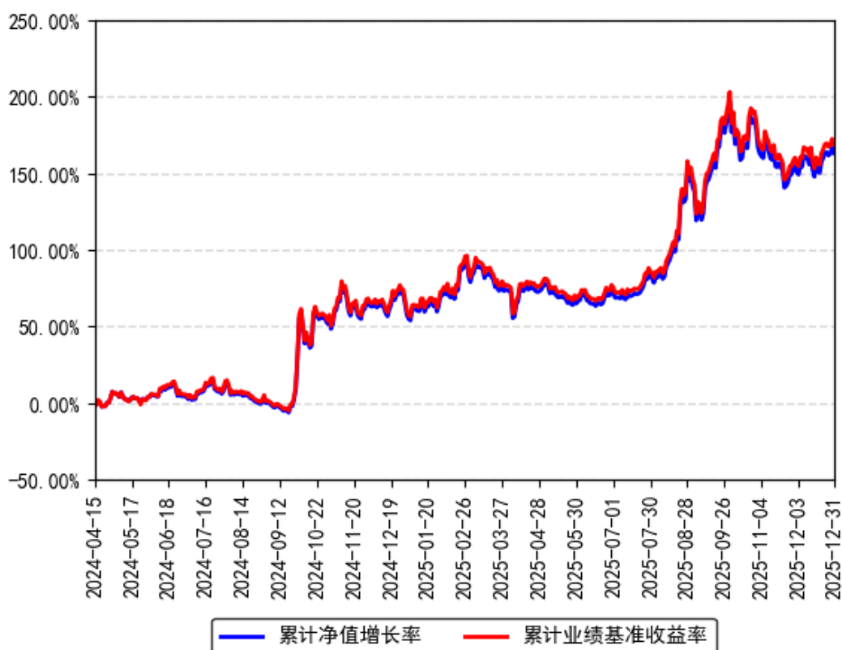
南方上证科创板芯片ETF累计净值增长率与同期业绩比较基准收益率的历史走势对比图