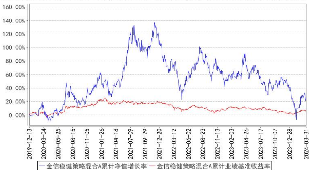
金信稳健策略混合A累计净值增长率与同期业绩比较基准收益率的历史走势对比图