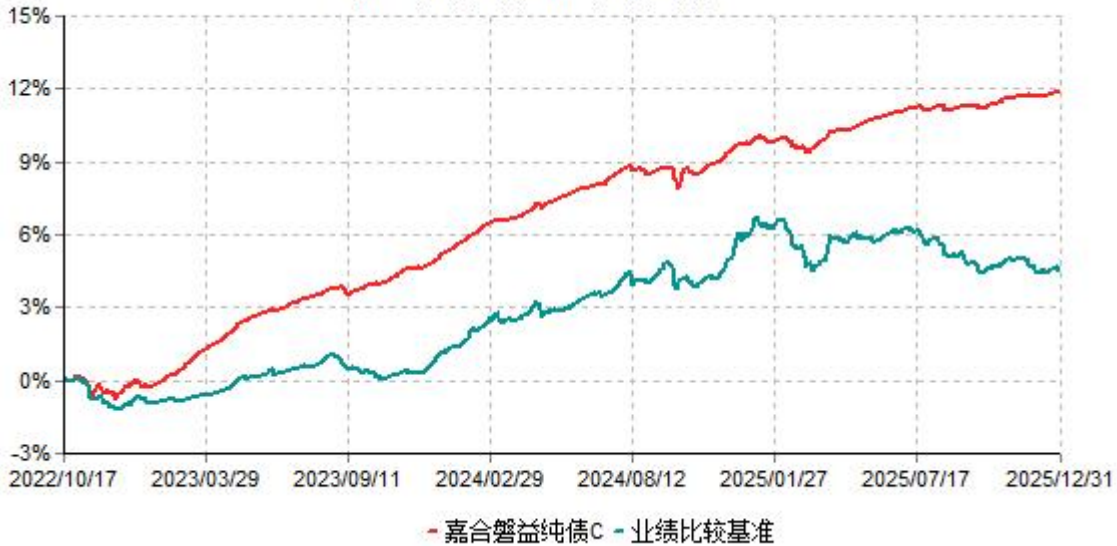
嘉合磐益纯债C累计净值增长率与业绩比较基准收益率历史走势对比图 (2022年10月17日-2025年12月31日)