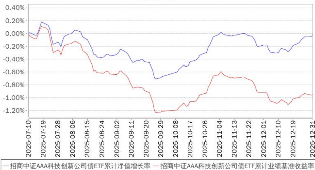
招商中证AAA科技创新公司债ETF累计净值增长率与同期业绩比较基准收益率的历史走势对比图