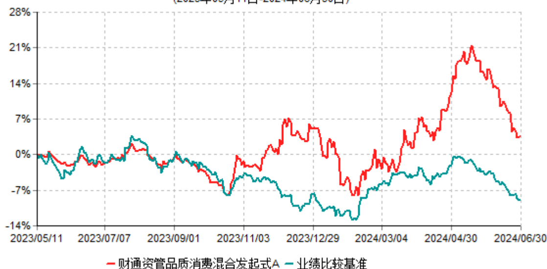
财通资管品质消费混合发起式A累计净值增长率与业绩比较基准收益率历史走势对比图 (2023年05月11日-2024年06月30日)