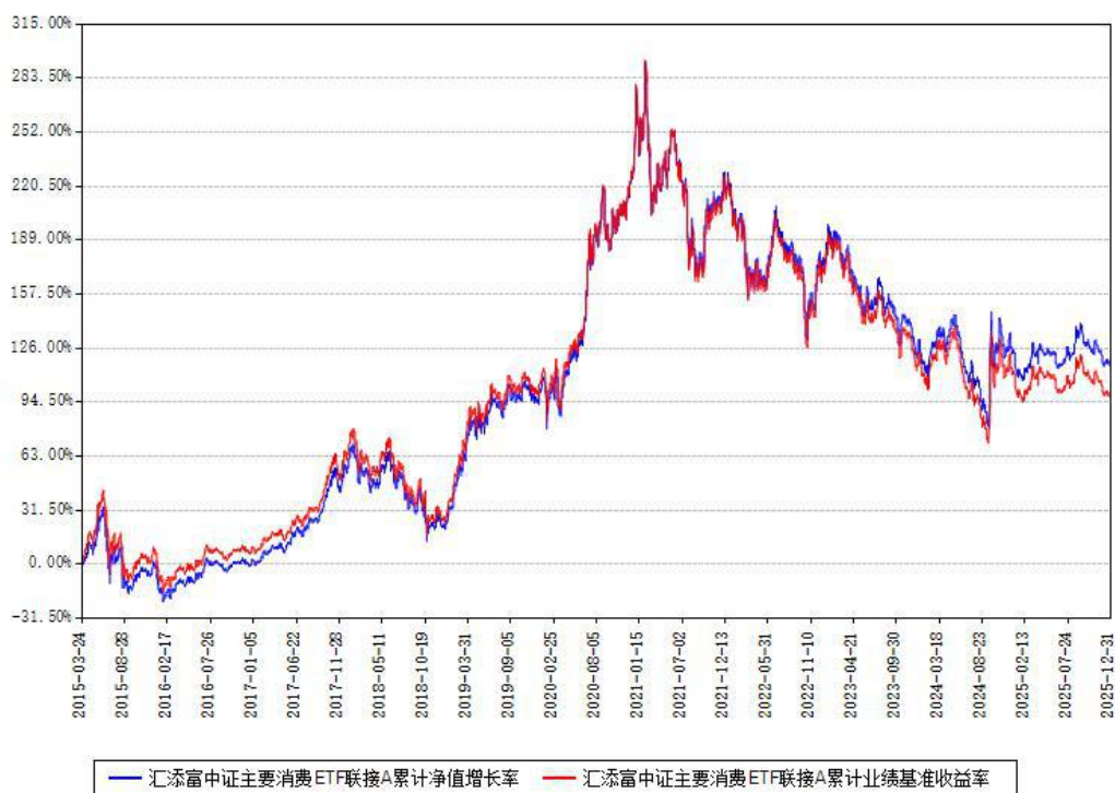
汇添富中证主要消费ETF联接A累计净值增长率与同期业绩基准收益率对比图