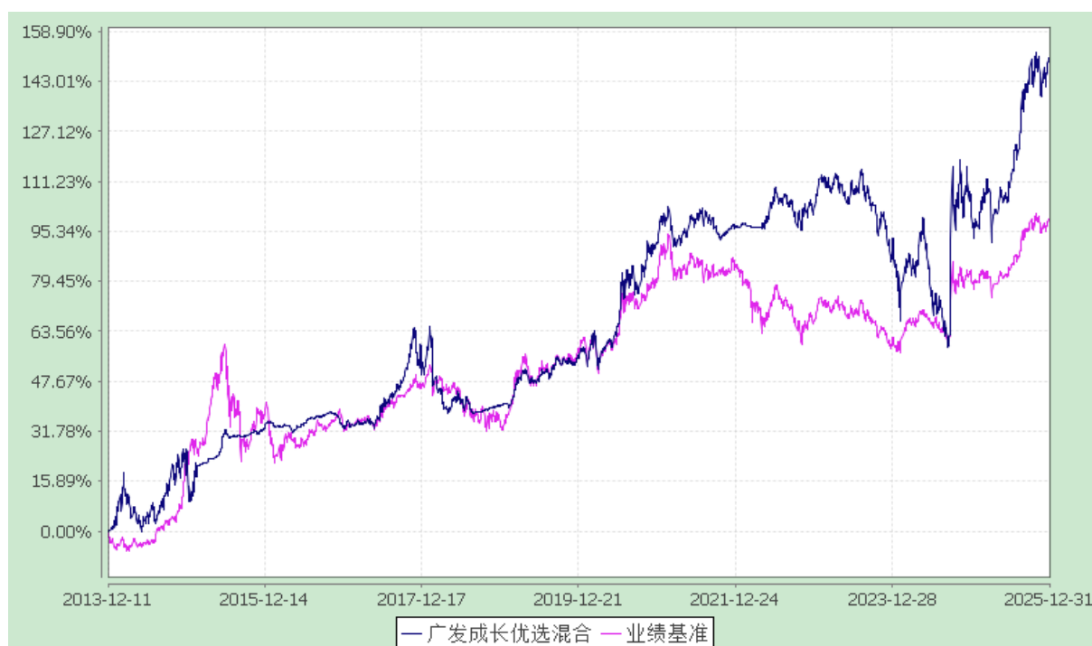
广发成长优选灵活配置混合型证券投资基金 份额累计净值增长率与业绩比较基准收益率的历史走势对比图 (2013 年 12 月 11 日至 2025 年 12 月 31 日)