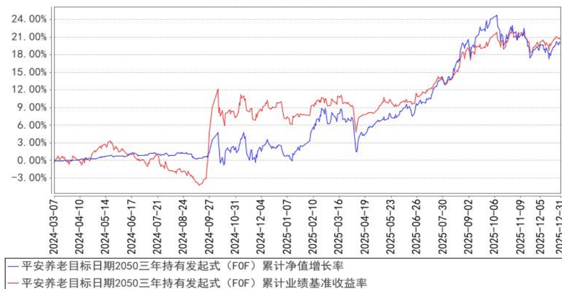
平安养老目标日期2050三年持有发起式 (FOF) 累计净值增长率与同期业绩比较基准收益率的历史走势对比图