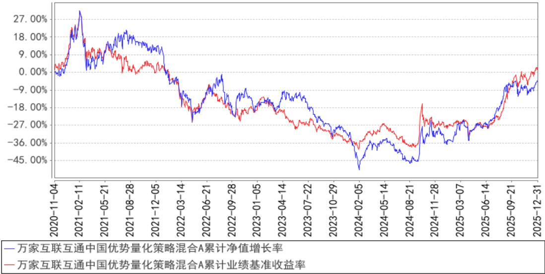
万家互联互通中国优势量化策略混合A累计净值增长率与同期业绩比较基准收益率的历史走势对比图