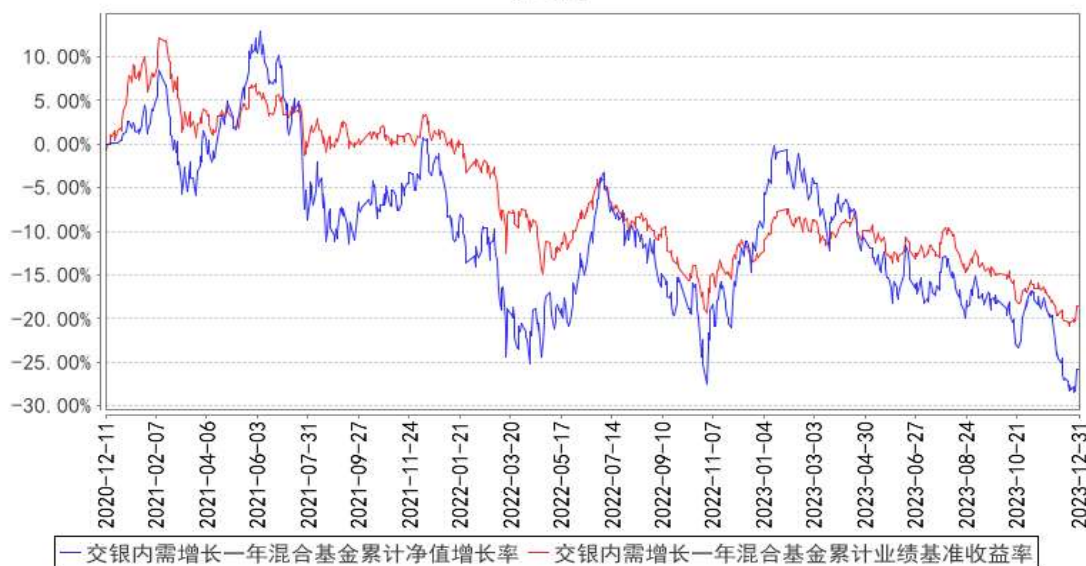
交银内需增长一年混合基金累计净值增长率与同期业绩比较基准收益率的历史走势对比图

注：本基金建仓期为自基金合同生效日起的 6 个月。截至建仓期结束，本基金各项资产配置比例符合基金合同及招募说明书有关投资比例的约定。