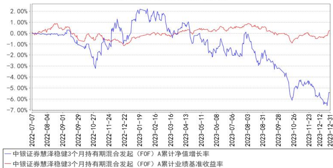
中银证券慧泽稳健3个月持有期混合发起（FOF）A累计净值增长率与同期业绩比较基准收益率的历史走势对比图