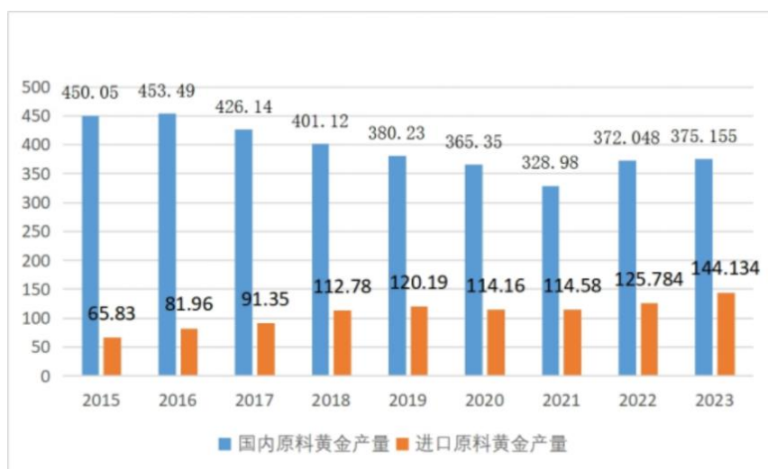
2015年—2023年黄金产量情况图（单位：吨）

由于黄金兼具商品属性、金融属性、货币属性，黄金价格受国际政治经济形势、实际利率、通胀预期及供给需求等因素影响。2023年黄金价格受国际政治经济风险上升、避险情绪增加，各国央行增加黄金储备等多重因素的影响下，国际和国内金价均整体呈震荡上行的趋势。根据中国黄金协会的数据，2023年，上海黄金交易所 Au9999 黄金 12 月底收盘价 479.59 元/克，较 2023 年初开盘价上涨 16.69%，全年加权平均价格为 449.05 元/克，同比上涨 14.97%。我国国内黄金供给增长缓慢和需求增长旺盛。根据中国黄金协会数据，2023 年，我国原料黄金产量为 375.155 吨，同比增长 0.84%；我国黄金消费量 1,089.69 吨，同比增长 8.78%；同时，中国人民银行全年累计增持黄金 224.88 吨，截至 2023 年底，我国黄金储备为 2,235.41 吨。