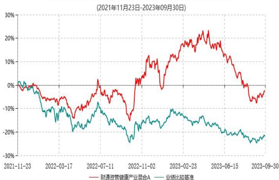
财通资管健康产业混合A累计净值增长率与业绩比较基准收益率历史走势对比图