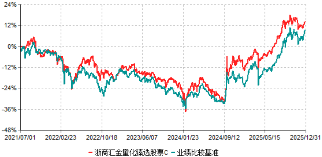
浙商汇金量化臻选股票C累计净值增长率与业绩比较基准收益率历史走势对比图 (2021年07月01日-2025年12月31日)

注：自2025年5月15日起，本基金的业绩比较基准由“中证500指数收益率×50%+中证港股通综合指数收益率×40%+中债总财富指数（总值）收益率×10%”，变更为“中证500指数收益率×85% +中债总财富指数（总值）收益率×10%+中证港股通综合指数收益率×5%”。