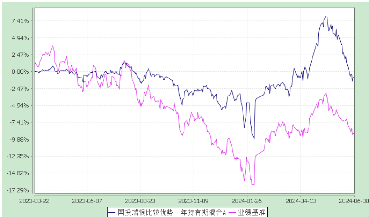
国投瑞银比较优势一年持有期混合 C