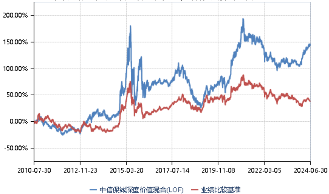
（二）基金累计净值增长率与业绩比较基准收益率的历史走势对比图