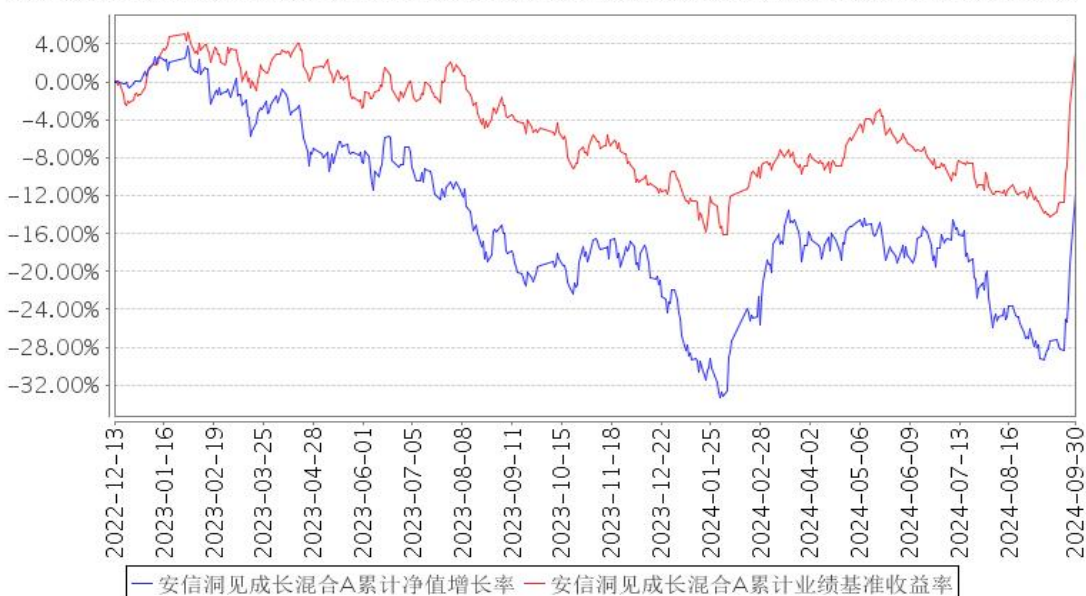
安信洞见成长混合A累计净值增长率与同期业绩比较基准收益率的历史走势对比图