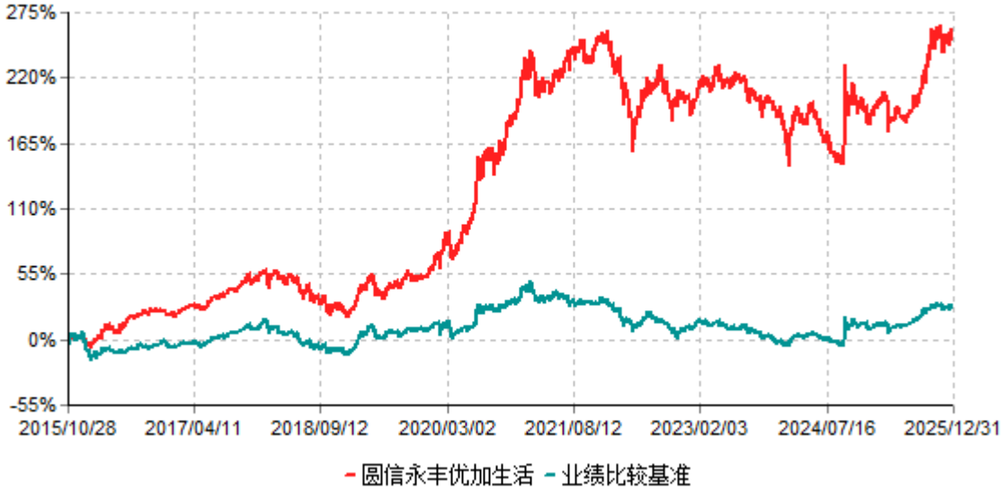
圆信永丰优加生活累计净值增长率与业绩比较基准收益率历史走势对比图 (2015年10月28日-2025年12月31日)