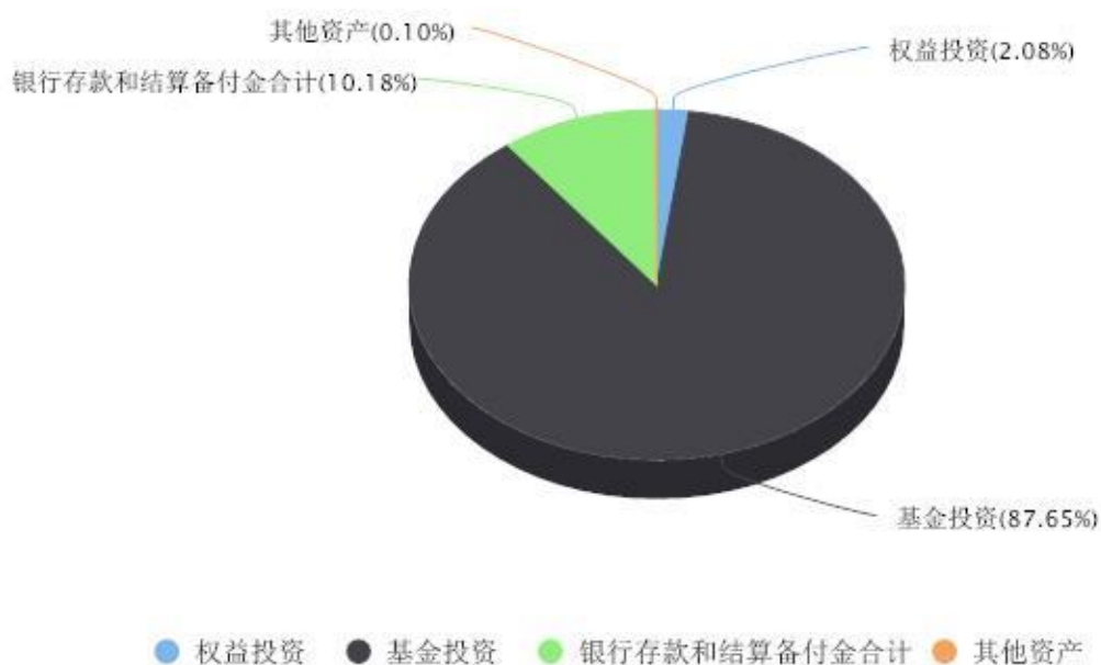
投资组合资产配置图表 数据截止日期:2023年09月30日