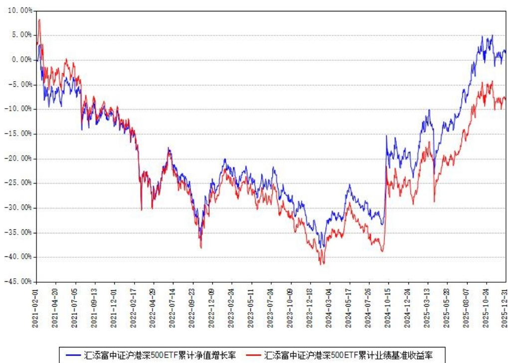
汇添富中证沪港深500ETF累计净值增长率与同期业绩基准收益率对比图

注：本基金建仓期为本《基金合同》生效之日（2021年02月01日）起6个月，建仓期结束时各项资产配置比例符合合同约定。