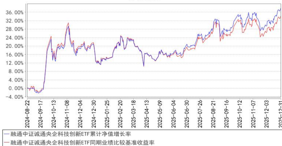
融通中证诚通央企科技创新ETF累计净值增长率与同期业绩比较基准收益率的历史走势对比图

注：本基金的建仓期为自合同生效日起 6 个月，至建仓期结束，各项资产配置比例符合合同约定。